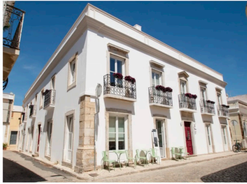
Fachada da Casa Amor, em Olhão

Fresca no verão e aquecida pela lareira no inverno, a sala de estar ou Sala de Inverno convida o hóspede a apreciar os arcos, abóbadas e colunas e a relaxar nos sofás, retirando um livro da biblioteca. Pode servir-se de uma bebida no honesty bar e distrair-se com os jogos de tabuleiro e o gira-discos. O enorme terço de madeira em destaque foi encontrado durante as obras e recuperado. Estaria na antiga capela privada.