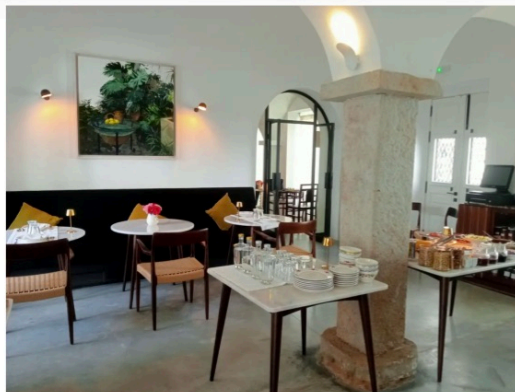
Sala de pequenos-almoços na Casa Amor

Fresca no verão e aquecida pela lareira no inverno, a sala de estar ou Sala de Inverno convida o hóspede a apreciar os arcos, abóbadas e colunas e a relaxar nos sofás, retirando um livro da biblioteca. Pode servir-se de uma bebida no honesty bar e distrair-se com os jogos de tabuleiro e o gira-discos. O enorme terço de madeira em destaque foi encontrado durante as obras e recuperado. Estaria na antiga capela privada.