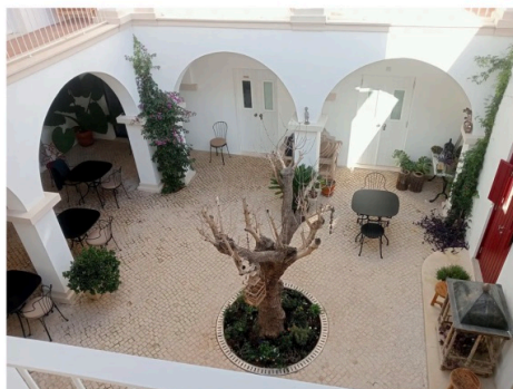
Pátio da Casa Amor