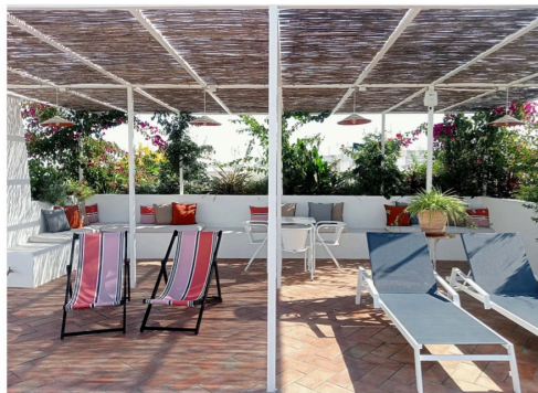
Recantos do rooftop da Casa Amor, em Olhão

Aumente o prazer refrescando-se na piscina de água salgada, mirando a cidade branca e o Cerro de São Miguel. Engalanada de buganvílias, a piscina é acessível a qualquer hora. Desde o miradouro observa-se o serpentear da ria Formosa, as ilhas-barreira e as estrelas ao luar.