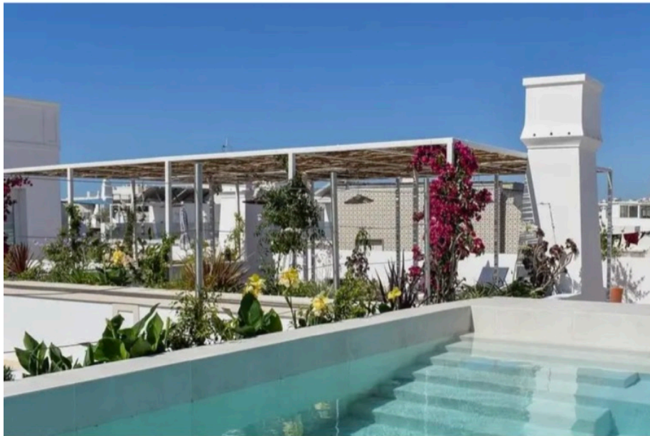
Casa Amor Boutique Hotel, em Olhão

Em Olhão, a Casa Amor dispõe de dez quartos airosos, coffee shop , sala de inverno e um rooftop com piscina de água salgada e vista panorâmica para a cidade “cubista” e a ria Formosa. Foi pensão e desde março é um pequeno refúgio em plena malha urbana